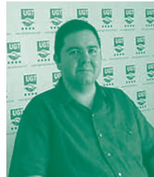
responsable del Gabinete de Seguridad y Salud y Medio Ambiente de la Federación de Servicios Públicos (GSSL-FSP).

¿Qué debería hacer la Administración para resolver la problemática de la siniestralidad?