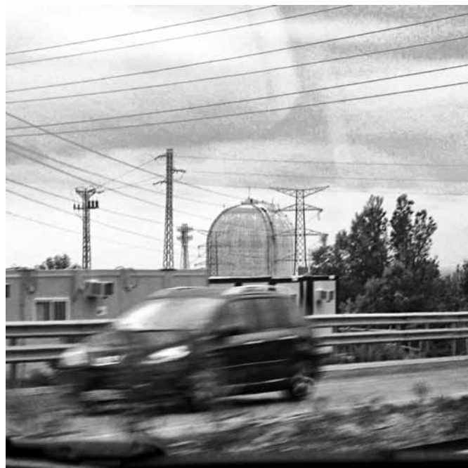
Central nuclear de Vandellòs

Actualment, ens trobem en un moment de debat per al futur del parc nuclear espanyol. El tancament de Santa María de Garoña, la central més antiga de la península situada a Burgos, es farà definitivament al 2013. Aquesta decisió presa pel Govern central no va agradar ni a treballadors ni a ecologistes. D'una banda, els treballadors estaven descontents per les pèrdues dels seus llocs