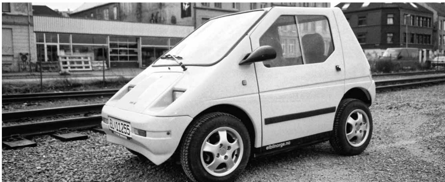
Cotxe elèctric