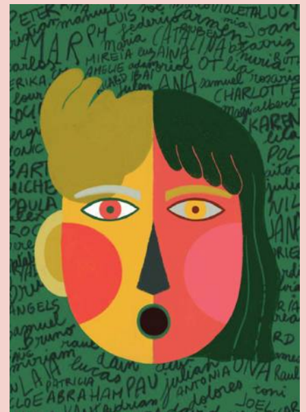
Il·lustració de Namibia Colorado del quadern Tenim Drets!

Proclama la base fonamental sobre la qual es construeixen tots els altres drets i llibertats reconeguts per la Declaració Universal dels Drets Humans. Se subratlla la igualtat inherent de tots els individus i la seva dignitat com a éssers humans. És un recordatori essencial que els drets humans són universals i inalienables, independentment de la religió, gènere o altres característiques.