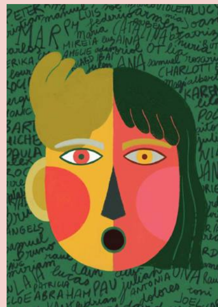
Ilustración de Namibia Colorado del cuaderno Tenim Drets!

Proclama la base fundamental sobre la que se construyen todos los demás derechos y libertades reconocidos por la Declaración Universal de los Derechos Humanos. Se subraya la igualdad inherente de todos los individuos y su dignidad como seres humanos. Es un recordatorio esencial de que los derechos humanos son universales e inalienables, independientemente de la religión, género u otras características.